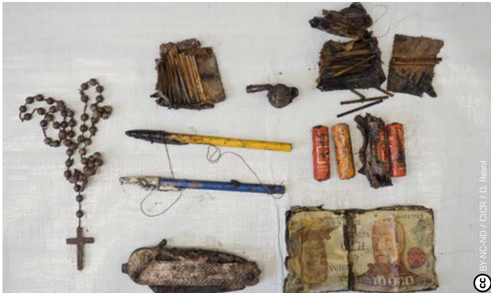
Objetos personales de soldados sepultados en el cementerio de Darwin hallados en 2017.